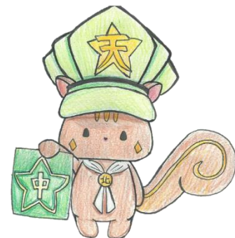
北中公式マスコットキャラクター 『ポラリス』